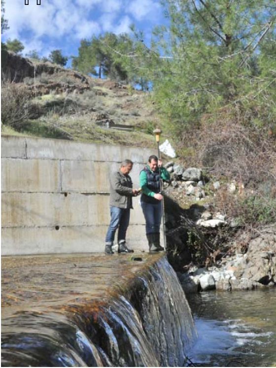
Χωρομετρικό συνεργείο οριοθετεί στην περιοχή Μαχαιρά