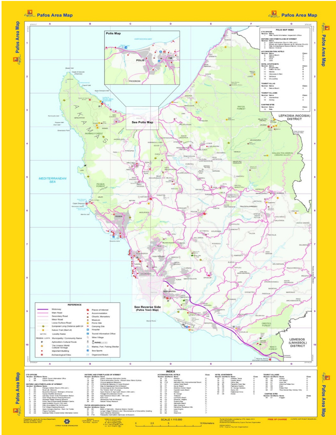
Νέος τουριστικός χάρτης της ευρύτερης περιοχής Πάφου (Ο χάρτης ετοιμάστηκε εξ' ολοκλήρου με ψηφιακές μεθόδους και διατέθηκε στον ΚΟΤ)